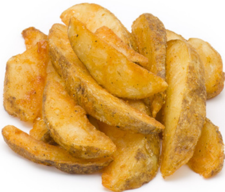
tǔ dòu kuài 土豆块