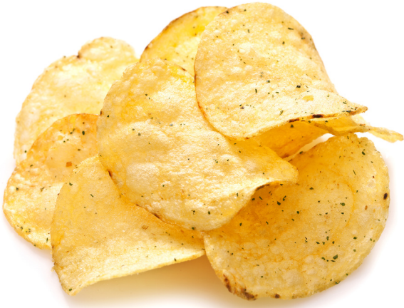
tǔ dòu piàn 土豆片