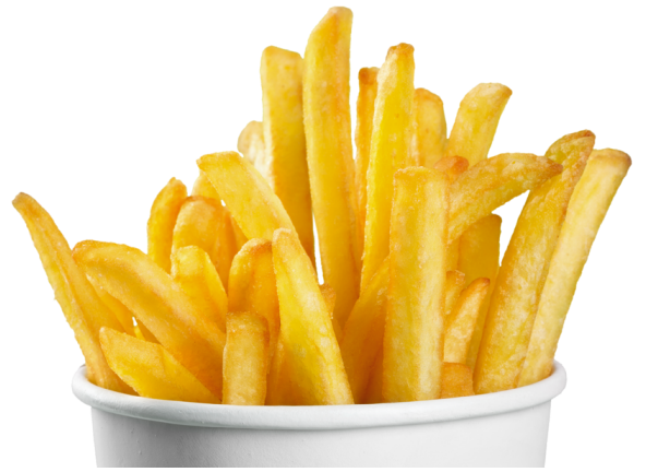
tǔ dòu sī 土豆丝